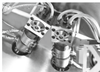
Seconda unità di preparazione materiale plastico e unità di scarico